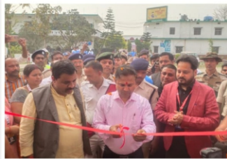
फोटो : थ्रोबॉल मैच का उद्घाटन करते डीएम

पंचदेवरी के मचवा में चल रहा है राष्ट्रीय थ्रोबॉल चैंपियनशिप